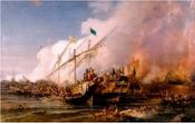
যুদ্ধের কাল্পনিক চিত্র